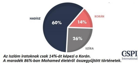
A TRILÓGIA SZÖVEGEINEK RELATÍV MÉRETE

Az iszlám iratoknak csak 14%-át alkotja a Korán. A maradék 86%-ban Mohamed életéről szóló történetekre és legendákra épül. Mindez azt jelenti, hogy az iszlám ideológiája elsősorban a Mohamed körül kialakított kultuszra és követendő példájára épül. Mivel Mohamed nem csak próféta volt, de hadvezér és politikus is, ezért az iszlám nem csak vallás, hanem nagyon aktív politikai rendszer és ideológia, saját jogrenddel (saríja).